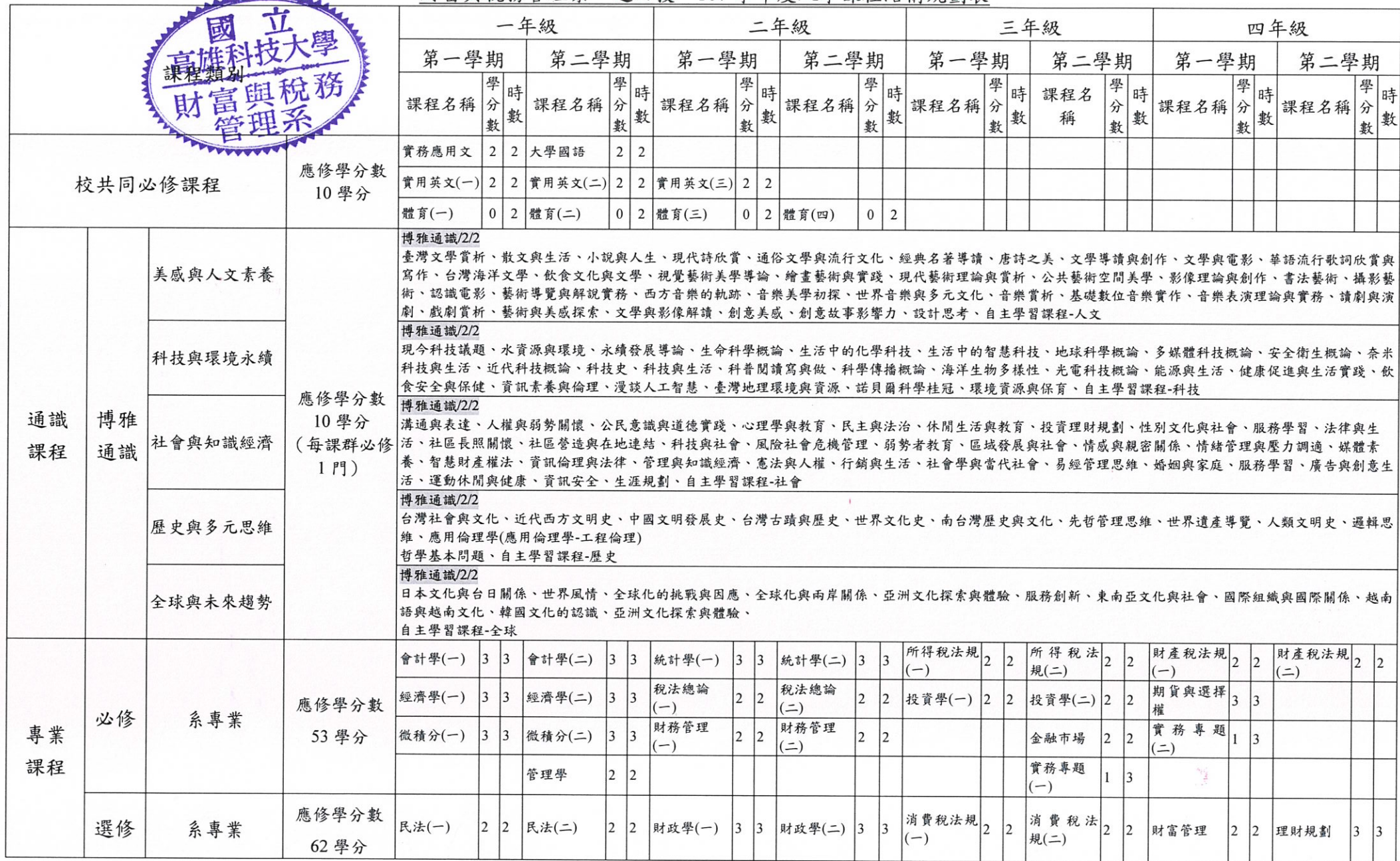
財富與稅務管理系 進四技 107 學年度入學課程結構規劃表